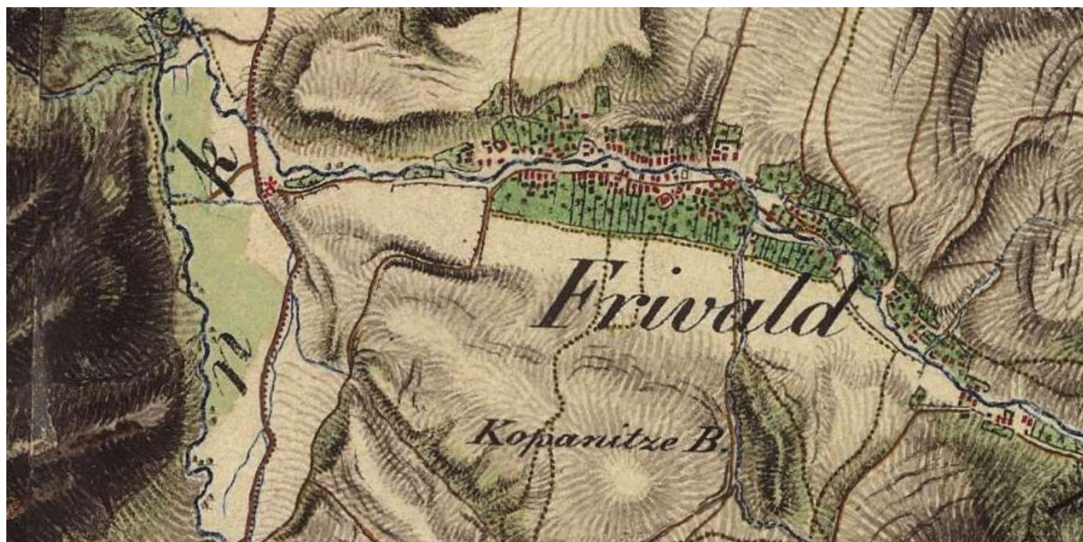
Obr. 2 Miesto stavby na 2. vojenskom mapovaní